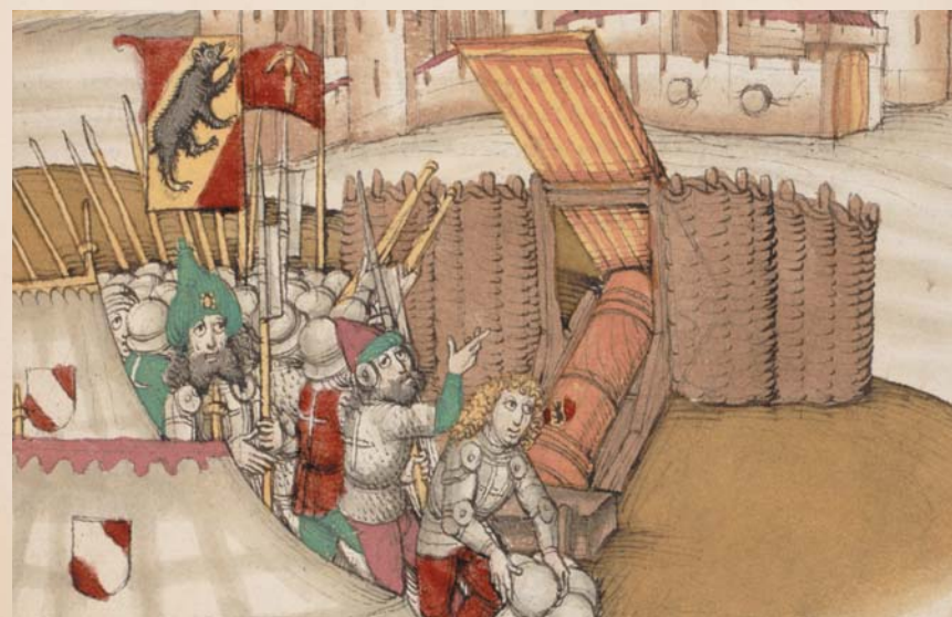
Titelbild: Burgerbibliothek Bern, Mss.h.h.I.16, p.619 Foto: Codices Electronici AG, www.e-codices.ch

Universität Bern, Hauptgebäude und Unitobler