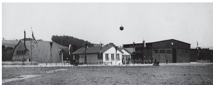
Der Flugplatz Bern-Belpmoos am Tag seiner Eröffnung im Jahr 1929.